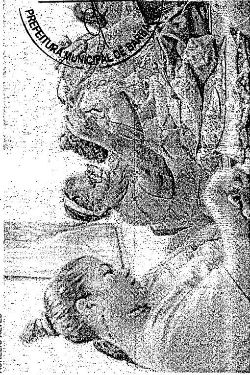
UNIFORMES usados viram bolsas pelas mãos de mulheres de comunidades